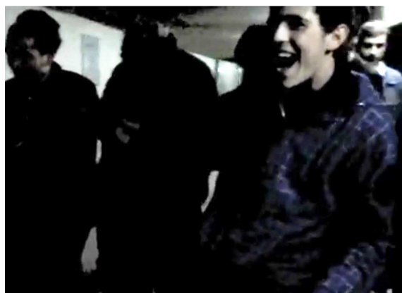
Tbilisi in the koma – kadr filmu zrealizowanego w ramach warsztatów Miast w koma