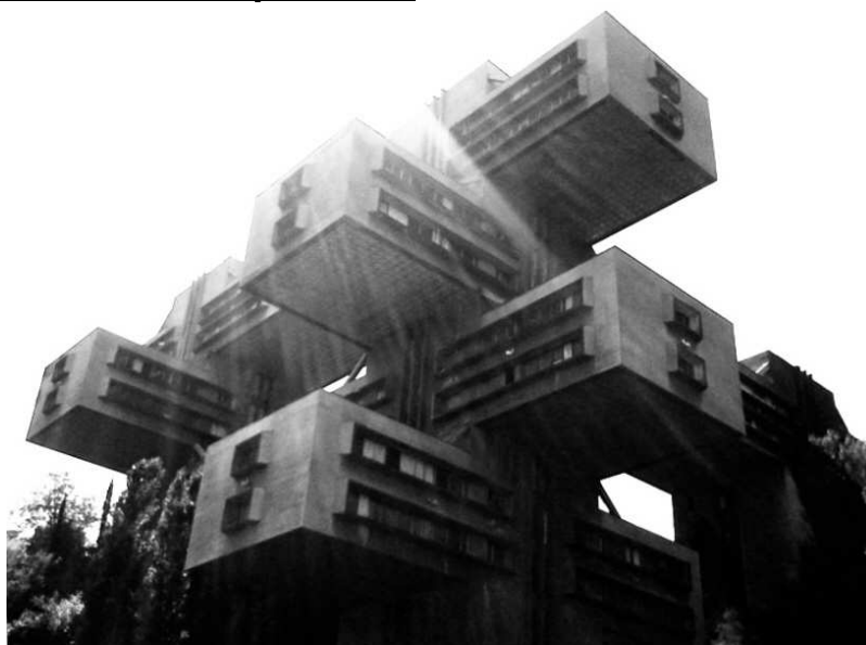
Ministerstwo Dróg i Transportu Gruzjińskiej Socjalistycznej Republiki Radzieckiej

Ruiny naszych czasów / Frozen Moments www.ruinsfourtimes.wordpress.com