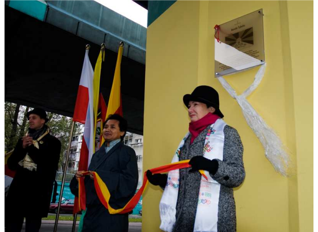
Odsłonięcie tablicy pamiątkowej – Rondo Tybetu