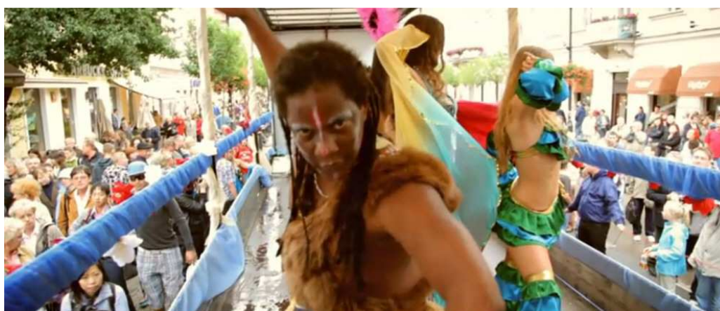
Kadr ze spotu dokumentującego IV Wielokulturowe Warszawskie Street Party