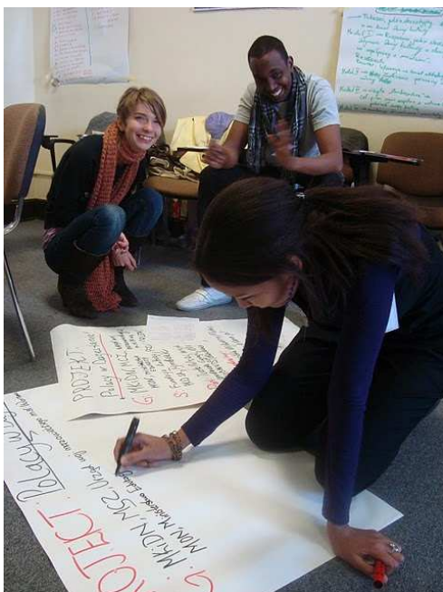
Warsztaty z pozyskiwania funduszy na działalność kulturalną i realizacji projektów