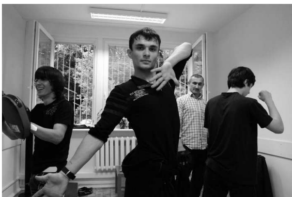
Zajęcia tańca Lovzar

Wśród zajęć odbywających się w ośrodku w 2010 roku były lekcje języka i kultury czecheńskiej oraz warsztaty tradycyjnej muzyki i tańców skierowane głównie do dzieci i młodzieży, czyli pokolenia które powoli zatracą narodową tożsamość. W Sintarze prowadzone były ponadto zajęcia z informatyki, języka i kultury polskiej, języka angielskiego, warsztaty teatralne oraz organizowane były wycieczki edukacyjne, a także szereg innych działań. W roku 2011 działalność ośrodka jest kontynuowana.