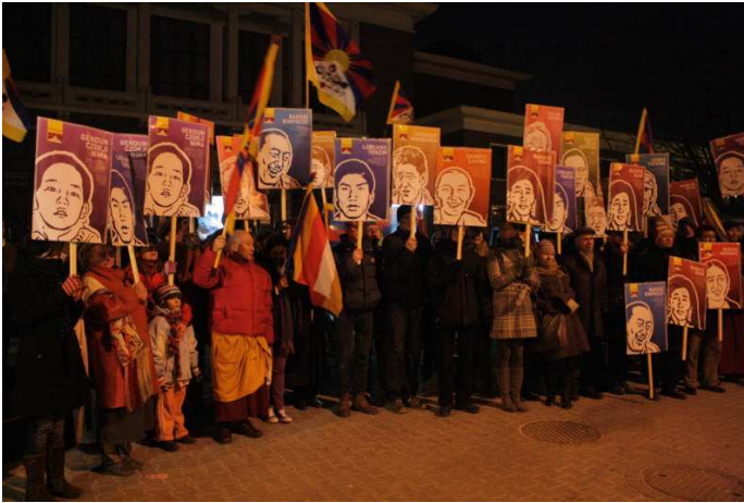
Tyberańscy bohaterowie – akcja 10 marca pod Ambasadą ChRL