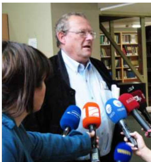
Przed wykładem Adama Michnika na Uniwersytecie w Tbilisi