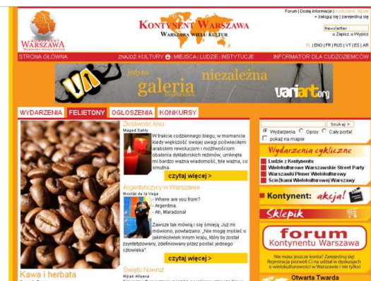
Screen portalu Kontynent.waw.pl