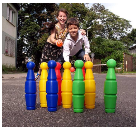
Letnie zajęcia przed ośrodkiem