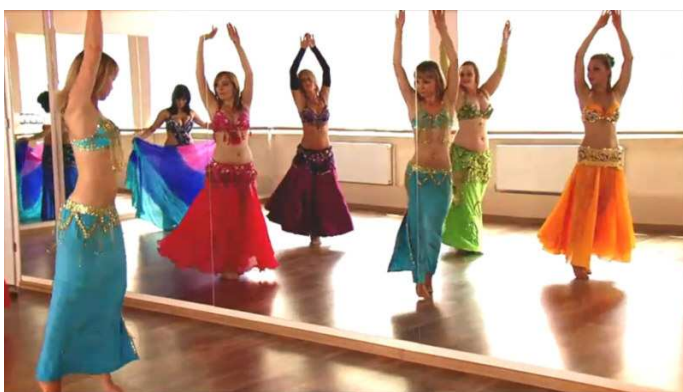
Kadr z filmu "Rowerem na koniec świata"

Powstały dwa kolejne odcinki trzyletniego cyklu filmów „Ścieżkami Wielokulturowej Warszawy – Alternatywny Przewodnik” ( www.kontynent.waw.pl/film ), wydawanego na płytach DVD, prezentującego Warszawę jako stolicę na poziomie innych miast europejskich, w której znalazło przestrzeń do życia oraz działalności i rozwoju wielu profesjonalnych artystów pochodzących z innych krajów, oraz wywodzących się z mniejszości etnicznych, a także znajduje się wiele miejsc, związanych z kulturą mniejszości etnicznych oraz innych narodów. Odcinek III nosi tytuł Kurs na wschód, odcinek IV – Rowerem na koniec świata.